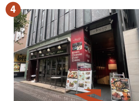
右手にLOFTが入ったビルが見えますので、そちらの地下1階が「BAGUS PLACE」となります。LOFT入口横にBAGUS PLACE専用の入口をご用意しておりますのでそちらからお入りください。 ※LOFTビル入口にはエレベーターのご用意も御座います。