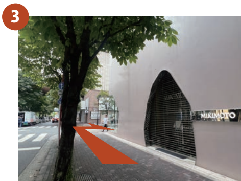
一つ目の十字路（並木通り）を右へお進みください。