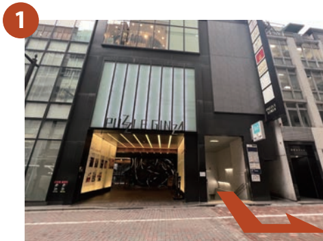
銀座一丁目駅「5番出口」を出て左方向にお進みください。