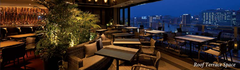
Roof Terrace Space