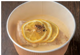
大山鶏の瀬戸内れもんクリーム煮 Simmered Daisen chicken with Setouchi lemon cream ¥750