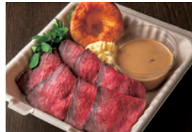
蔵王牛のローストビーフ ヨークシャープディング Zao roast beef and Yorkshire Pudding ¥2,000