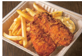
大山鶏のチキン&チップス Fish and Chips made with Daisen chicken ¥1,200