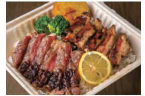
スモークチキン& ビーフステーキ弁当 ¥1,000