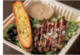
ローストスモークチキンと グリルドシーザーサラダのプレート バターパケット付き ¥1,000