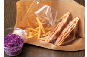
スモークターキーと大葉の チーズホットサンド 紫キャベツのコールスロー付き ¥600