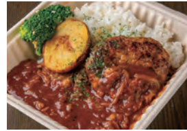
PUBLIC ハッシュドビーフ ハンバーグ弁当 ¥1,000