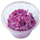
紫キャベツのコールスロー Red cabbage coleslaw