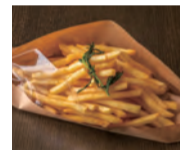
ガーリックローズマリー

OSAKA ..... 焦がしキャベツ・ソース・青のり・紅ショウガ HAKATA ..... 明太子1本・辛子高菜 NEW YORK チリコンカンビーンズ・チェダーチーズ