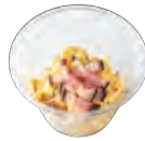
北海道 北あかりと 燻製卵のポテトサラダ Smoked egg mixed with Hokkaido Kitakari potato salad