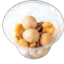
うずらの卵とナッツの燻製 Smoked quail egg with smoked nut