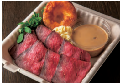
蔵王牛のローストビーフ ヨークシャーピング Zao roast beef and Yorkshire Pudding ¥ 2,160