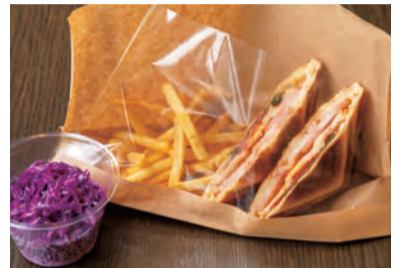
スモークターキーと大葉の チーズホットサンド 紫キャベツのコールスロー付き ¥ 650