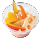
利尻 昆布出汁のピクルス Rishiri kelp soup stock pickles