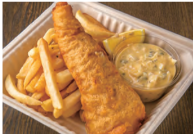
真鱈のフィッシュ&チップス Fish and Chips made with Pacific cod ¥ 1,620