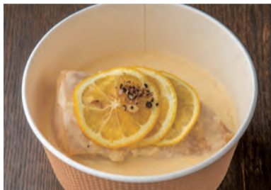
大山鶏の瀬戸内れもんクリーム煮 Simmered Daisen chicken with Setouchi lemon cream ¥ 810