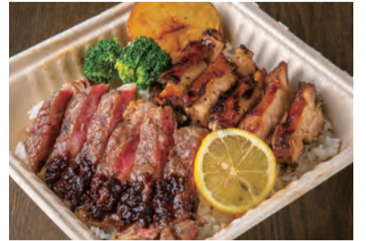
スモークチキン& ビーフステーキ弁当 ¥ 1,100