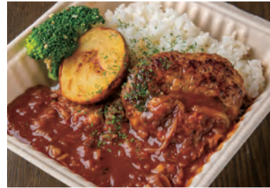
PUBLIC ハッシュドビーフ ハンバーグ弁当 ¥ 1,100