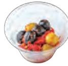
セミドライマトと オリーブのマリネ - 小豆島産オリーブオイル - Marinated Semi-dry tomatoes and olives - Olive oil from Shodoshima -