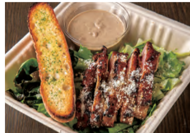
ローストスモークチキンと グリルドシーザーサラダのプレート バターバケット付き ¥ 1,100