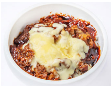
チーズ炙りカルビ丼