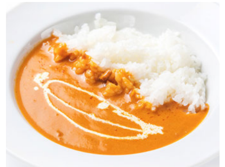
バターチキンカレー ¥640