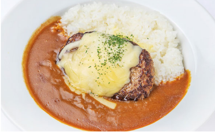
チーズハンバーグカレー ¥1030