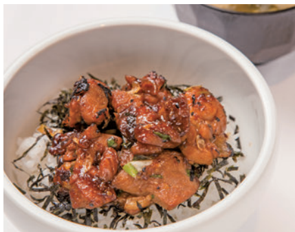
焼鳥丼 (味噌汁付き) ¥590