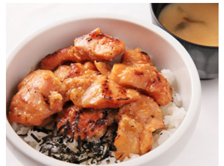
焼鳥丼・塩 (味噌汁付き) ¥590