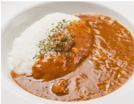
オリジナルカレー ¥530