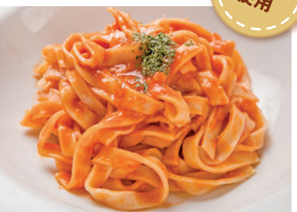
蟹のトマトクリーム