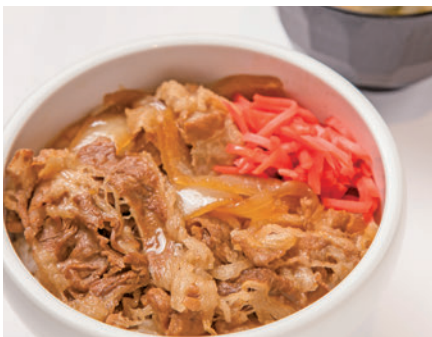
牛丼 (味噌汁付き) ¥590