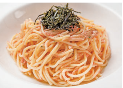
たらこと舞茸のパスタ